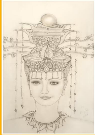
THE HUMAN BEING MOTHER WANGMU NIANGNIANG PHẬT ĐIỀU TRỊ ĐỊA MẪU NHẬT NHẤT ĐẠI THÁNH MẪU

Kinh Thiên Tâm Đạo hành trì bất cứ lúc nào giờ nào khi tiện lợi, chỉ trong một giờ mà được rất nhiều công đức rất lớn bao gồm: