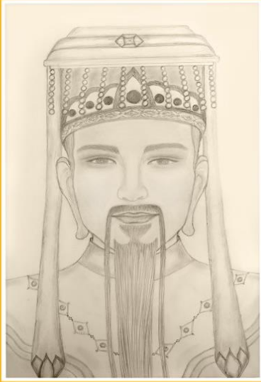
THE JADE LORD THE HIGHEST EMPEROR YUHUANG DADI NGỌC HOÀNG THƯỢNG ĐẾ ĐỨC CHÚA TRỜI - ALLAH - PREMIER GOD